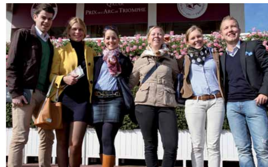
Das Sieger-Team der GERMAN RACING Concept Challenge 2012 beim Prix de l'Arc de Triomphe in Longchamp

Die anspruchsvolle Aufgabenstellung, eine hochkarätige Jury, 6.000 Euro Preisgeld, eine Reise zum White Turf in St Moritz für das Siegerteam, ein attraktives Rahmenprogramm und Partner der Spitzenklasse bieten einen starken Anreiz für motivierte junge Talente, am Wettbewerb