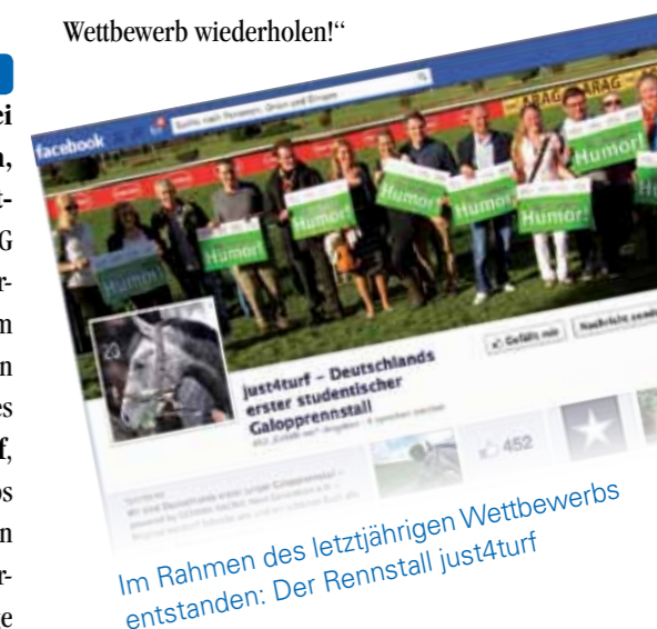
Im Rahmen des letztjährigen Wettbewerbs entstanden: Der Rennstall just4turf

hat uns selbst überrascht und ließ für uns nur einen Schluss zu: Wir müssen diesen tollen Wettbewerb wiederholen!“